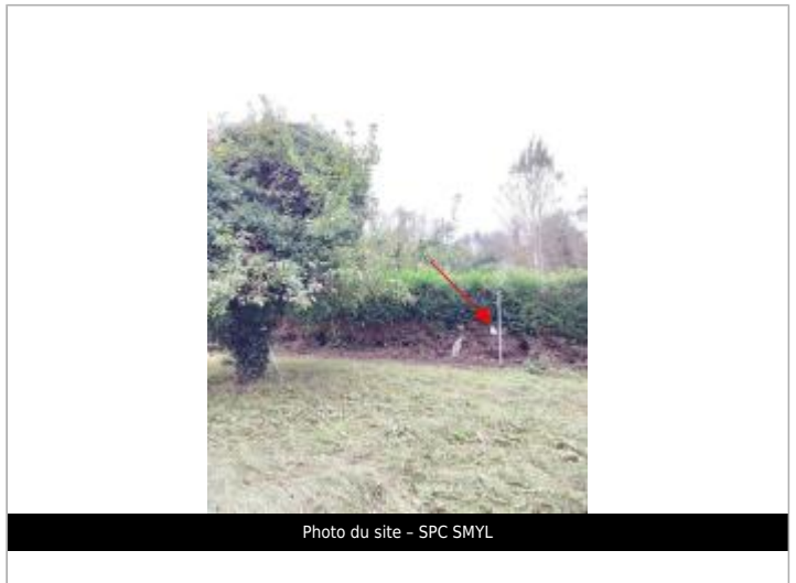
Photo du site - SPC SMYL

Coordonnées WGS84 : X: 2.95579860 / Y: 48.82487240