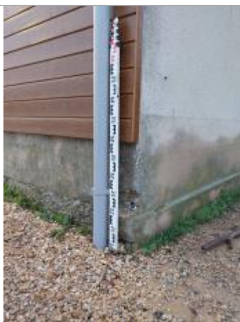
Photo du repère - SPC SMYL

Altitude calculée de l'eau (en m) : 46.46 m