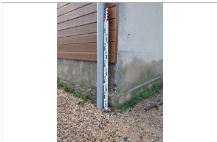
Photo du repère - SPC SMYL

Altitude calculée de l'eau (en m) : 46.46 m