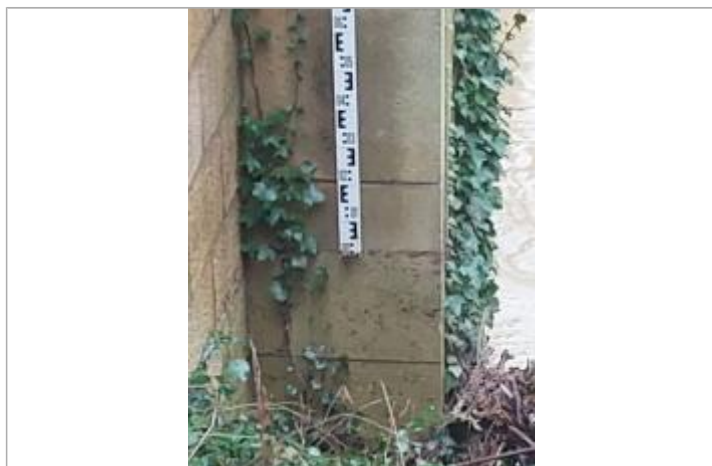
Photo du repère - SPC SMYL