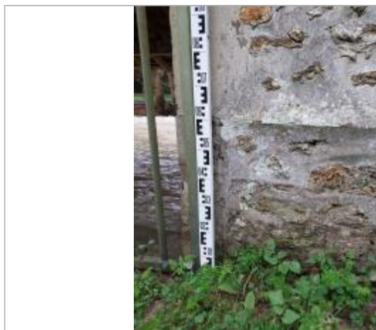
Photo du repère - SPC SMYL