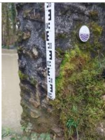
Photo du repère - SPC SMYL

Altitude calculée de l'eau (en m) : 67.25 m