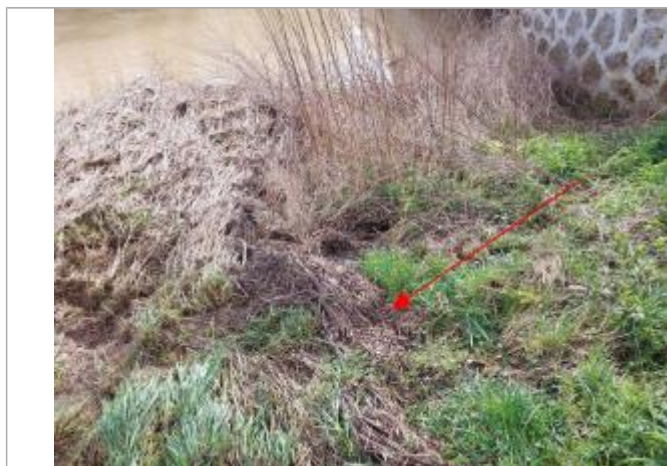
Photo du repère - SPC SMYL

Altitude calculée de l'eau (en m) : 124.78 m