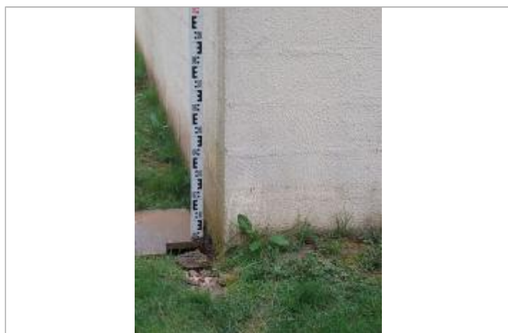
Photo du repère - SPC SMYL

Altitude calculée de l'eau (en m) : 47.19