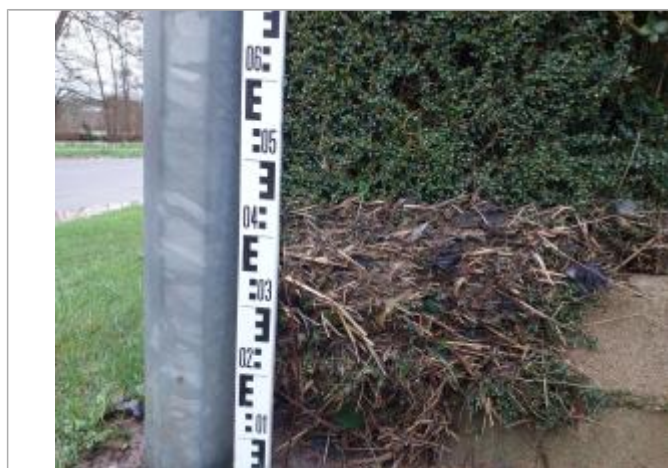
Photo du repère - SPC SMYL

Altitude calculée de l'eau (en m) : 52.05