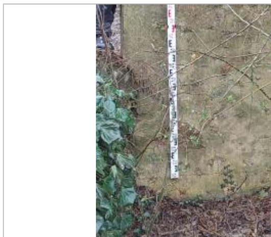
Photo du repère - SPC SMYL

Altitude calculée de l'eau (en m) : 66.94