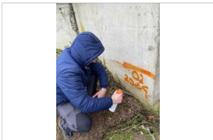
Photo du repère - SPC SMYL