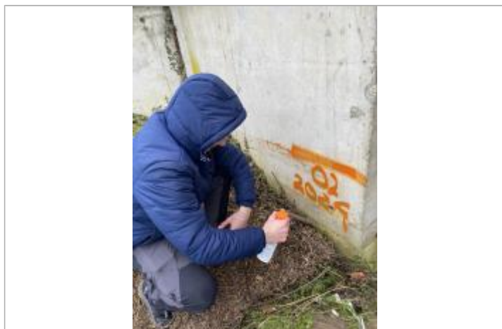
Photo du repère - SPC SMYL

Altitude calculée de l'eau (en m) : 76.06