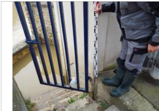
Photo du repère - SPC SMYL