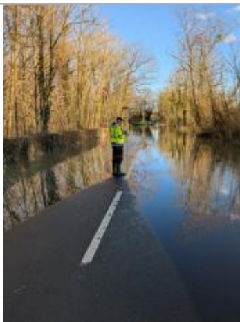
Laisse de crue au sol.