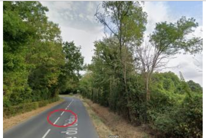
Vue depuis la route du Château.

Coordonnées WGS84 : X: -0.38135461 / Y: 49.15798110