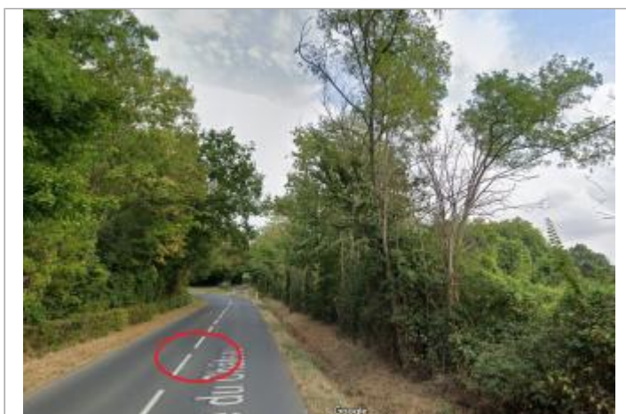
Vue depuis la route du Château.

GÉOLOCALISATION Coordonnées WGS84 : X: -0.38135461 / Y: 49.15798110 Coordonnées RGF93 (Lambert 93) : X: 453408 / Y: 6900637.7 Coordonnées RGF93 (ETRS89) : X: -0.3813546 / Y: 49.1579811 Code Hydro: I2--0200 Rive de référence: Gauche