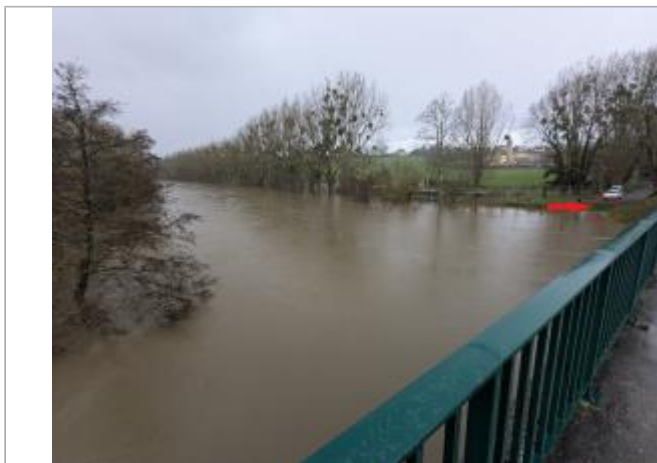
Vue depuis la RD89 sur le pont en rive gauche.