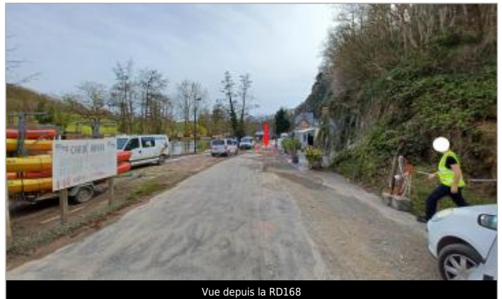
Vue depuis la RD168

Coordonnées WGS84 : X: -0.47601699 / Y: 48.91288630