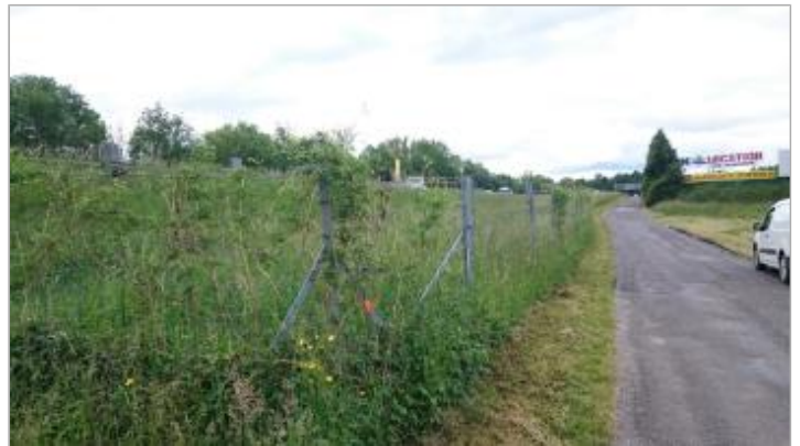
grillage sur voie communale n°9