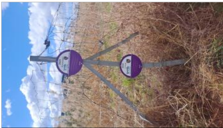
crue de l'Arve du 14 novembre 2023