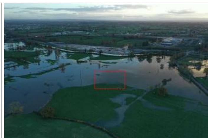
Photographie de l'inondation prise par drone le 15/11/2023 à 17h55

GÉOLOCALISATION Coordonnées WGS84 : X: 4.08116100 / Y: 46.47301300 Coordonnées RGF93 (Lambert 93) X: 782952.41 / Y: 6597570.85 Coordonnées RGF93 (ETRS89) : X: 4.081161 / Y: 46.473013 Code Hydro: K13-0300 Rive de référence: Droite