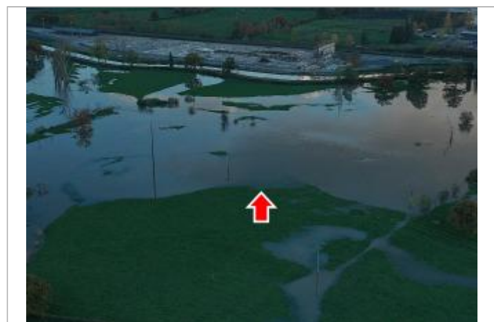
Photographie prise par drone le 15/11/2023 à 17h55 zommée sur le repère

GÉNÉRAL Code : 24LACIBO1_R_74_1 Date de mise à jour : 14/03/2025 Auteur : SPC LACI