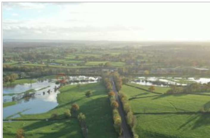
Photographie de l'inondation prise par drone le 15/11/2023 à 17h17