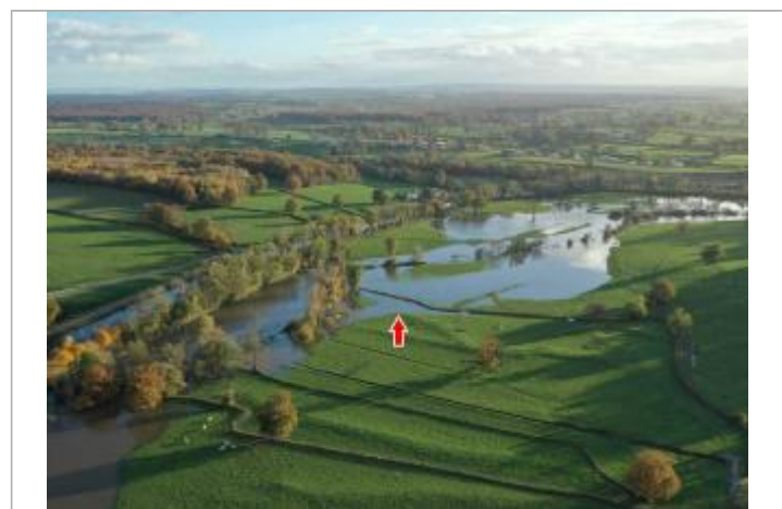
Photographie de l'inondation prise par drone le 15/11/2023 à 17h07

GÉNÉRAL Code : 24LACIBO1_R_72_1 Date de mise à jour : 14/03/2025 Auteur : SPC LACI