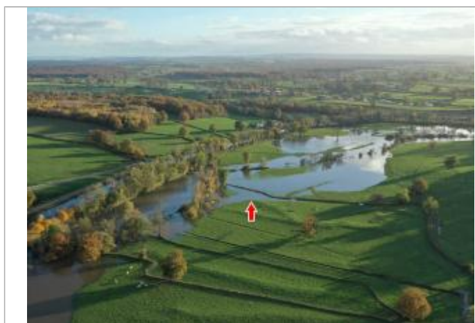
Photographie de l'inondation prise par drone le 15/11/2023 à 17h07