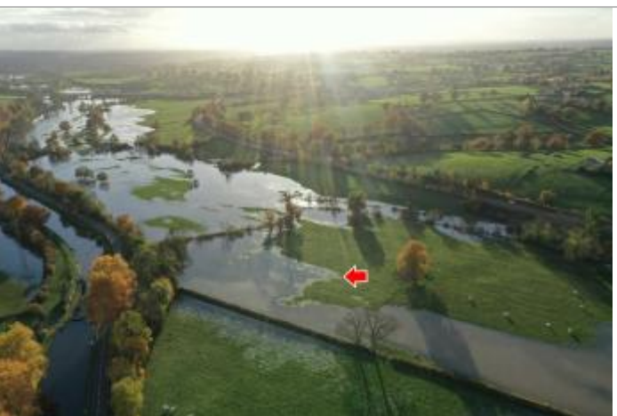
Photographie de l'inondation prise par drone le 15/11/2023 à 17h06