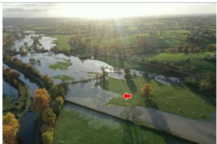
Photographie de l'inondation prise par drone le 15/11/2023 à 17h06

Altitude calculée de l'eau (en m) : 245 m