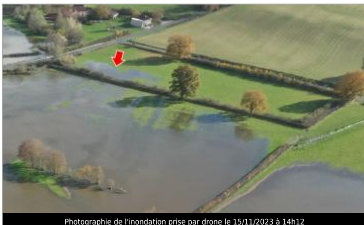
Photographie de l'inondation prise par drone le 15/11/2023 à 14h12