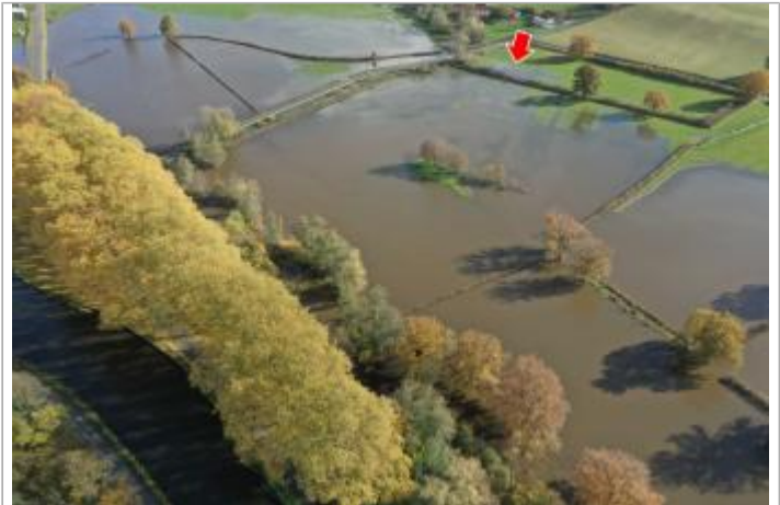
Photographie de l'inondation prise par drone le 15/11/2023 à 14h12

Coordonnées WGS84 : X: 4.29801100 / Y: 46.59774600