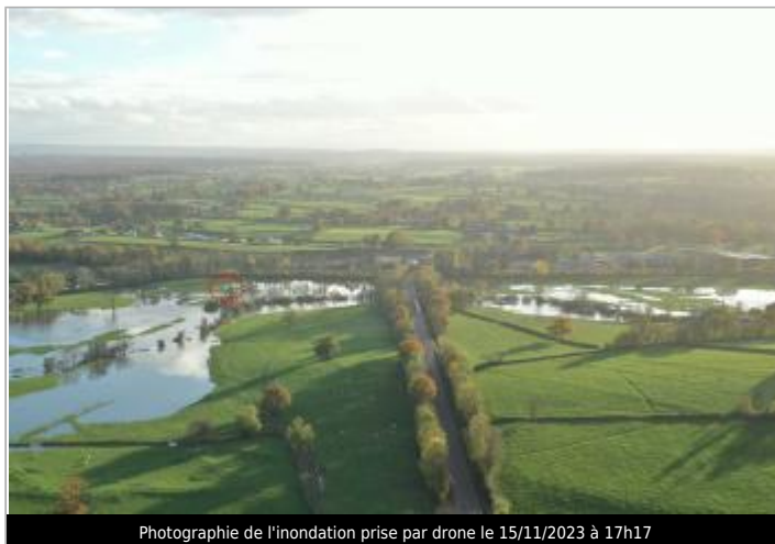
Photographie de l'inondation prise par drone le 15/11/2023 à 17h17

Coordonnées WGS84 : X: 4.15098800 / Y: 46.44282700