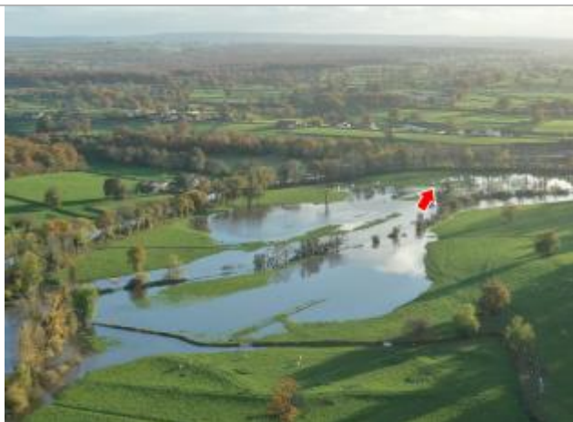
Photographie de l'inondation prise par drone le 15/11/2023 à 17h17

Altitude calculée de l'eau (en m) : 242.3