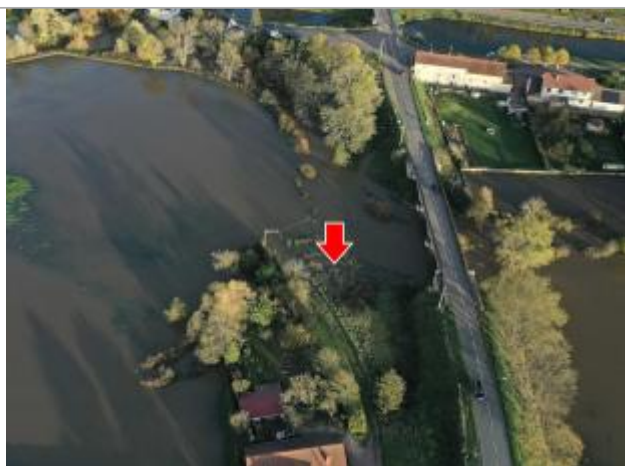
Photographie prise par drone le 15/11/2023 à 17h17

Altitude calculée de l'eau (en m) : 243.05