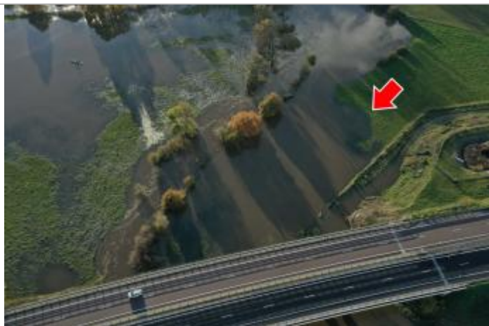
Photographie prise par drone le 15/11/2023 à 17h11

Altitude calculée de l'eau (en m) : 244.3