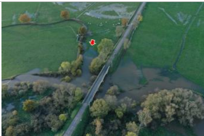
Photographie prise par drone le 15/11/2023 à 16h30

Altitude calculée de l'eau (en m) : 249.8