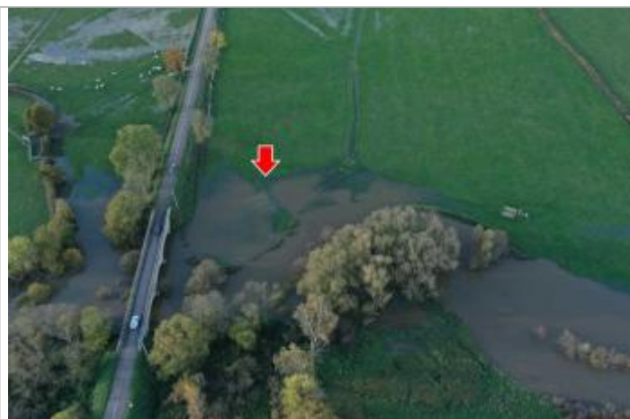
Photographie de l'inondation prise par drone le 15/11/2023 à 16h33

Altitude calculée de l'eau (en m) : 249.9