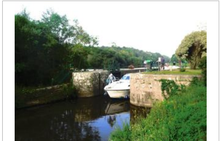
Ecluse de Clan aval à Guillac

Coordonnées WGS84 : X: -2.51778757 / Y: 47.93097340