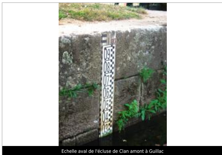
Echelle aval de l'écluse de Clan amont à Guillac

Altitude calculée de l'eau (en m) : 29.062 m