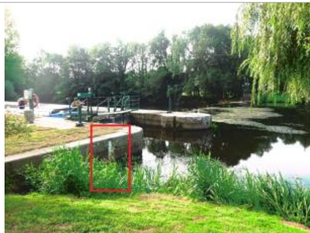
Ecluse de Clan amont à Guillac