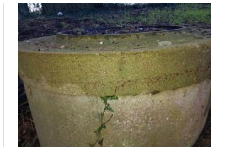
laisse de crue sur regard