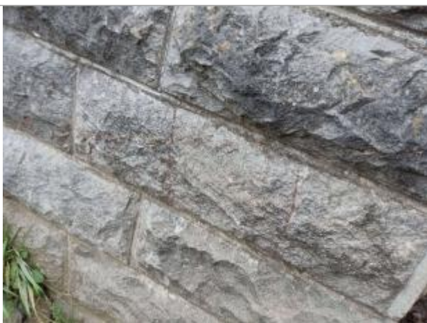
laisse de crue sur pile de pont côté aval