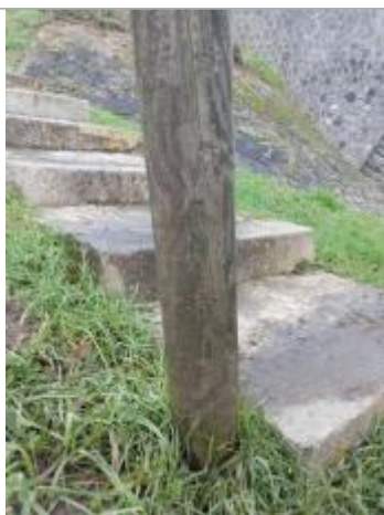
laisse de crue sur poteau près de l'escalier en aval du pont

Altitude calculée de l'eau (en m) : 36.59 m