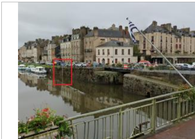
Echelle limnimétrique et confluence Vilaine - Canal de Nantes à Brest