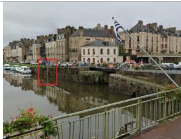
Echelle limnimétrique et confluence Vilaine - Canal de Nantes à Brest