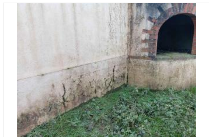
laisse de crue sur mur d'une propriété privée, accessible en bordure de Sarthe

GÉNÉRAL Code : WEB_R_202503134140 Date de mise à jour : 19/03/2025 Auteur : RDI-DDT72