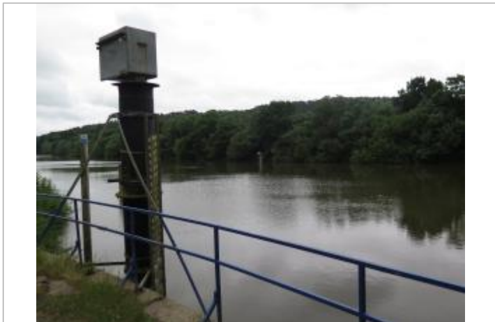
Station hydrométrique de Eaux &amp; Vilaine (EPTB Vilaine)

Altitude calculée de l'eau (en m) : 6.95 m