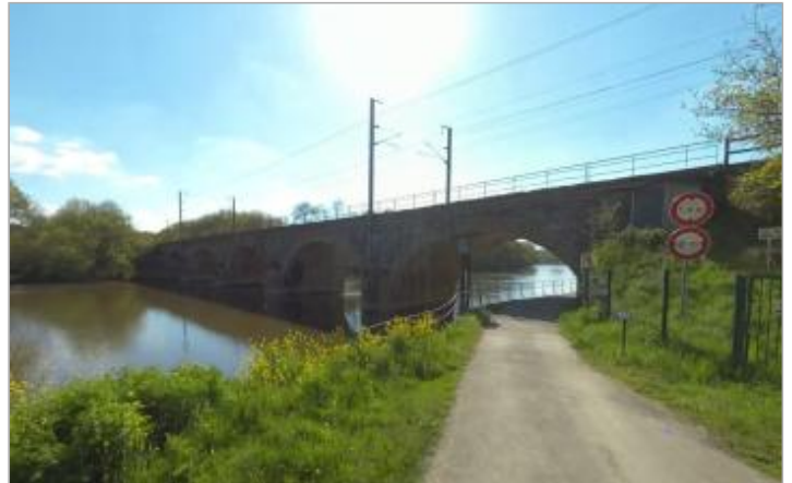
Station hydrométrique de Eaux &amp; Vilaine (EPTB Vilaine)

Coordonnées WGS84 : X: -1.85242554 / Y: 47.70833840