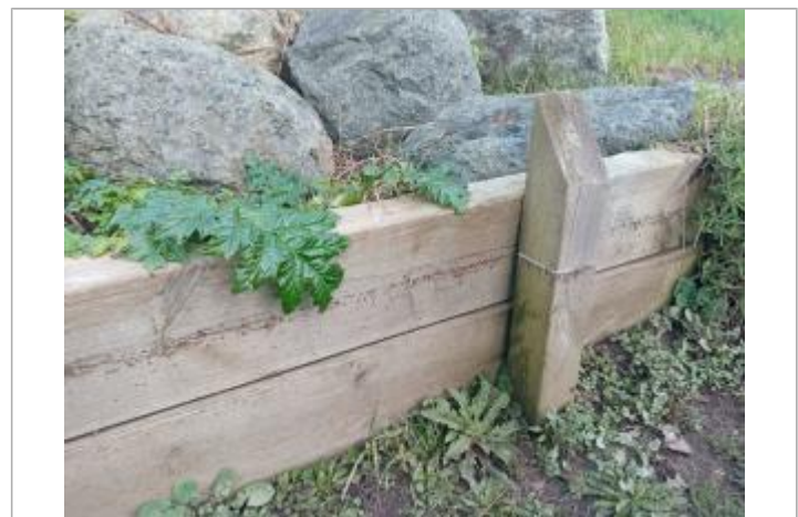
marque au niveau de la laisse de crue