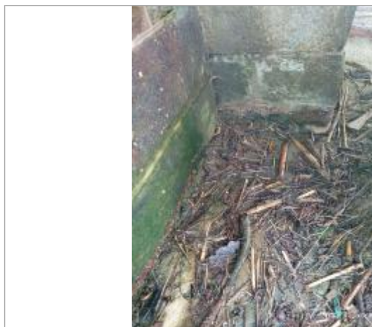
laisse d'inondation avant marquage