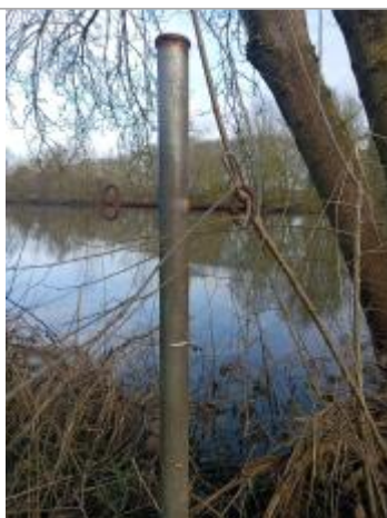
marque sur poteau