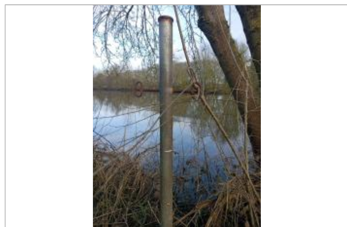
marque sur poteau

GÉNÉRAL Code : WEB_R_202503133338 Date de mise à jour : Auteur : RDI-DDT72 19/03/2025