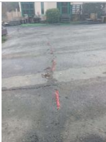
marquage peinture au niveau de la laisse d'inondation

Altitude calculée de l'eau (en m) : 32.83 m