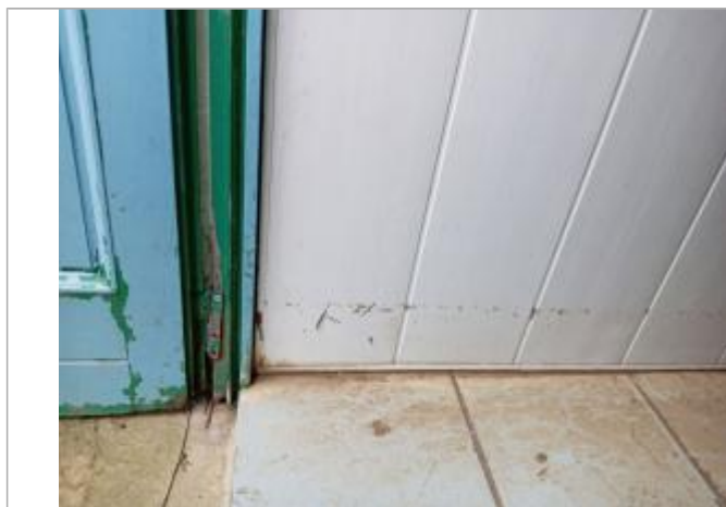
laisse de crue dans les toilettes de la capitainerie