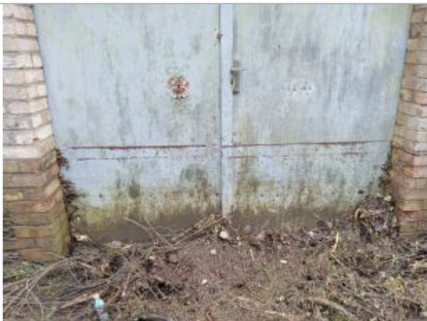
laisse de crue sur portail, à l'extrémité de la parcelle sud du port