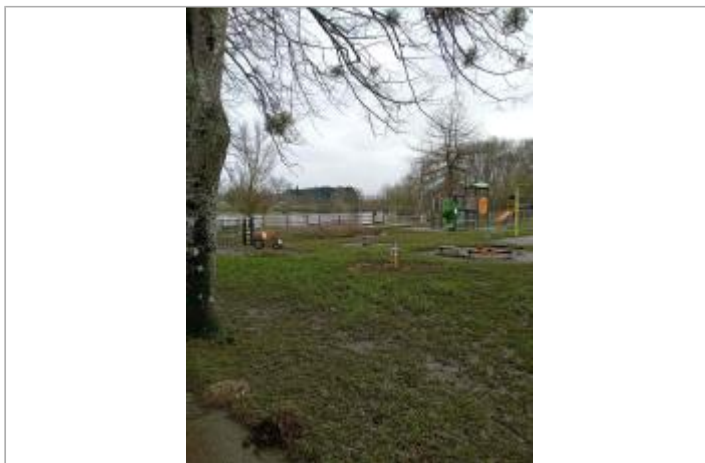
aire de loisirs à la décrue