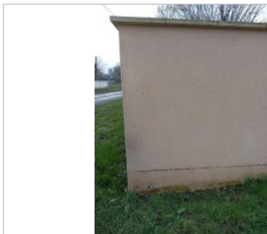
laisse de crue sur le mur de la maison en bas de la rue après la place St Georges Guiet