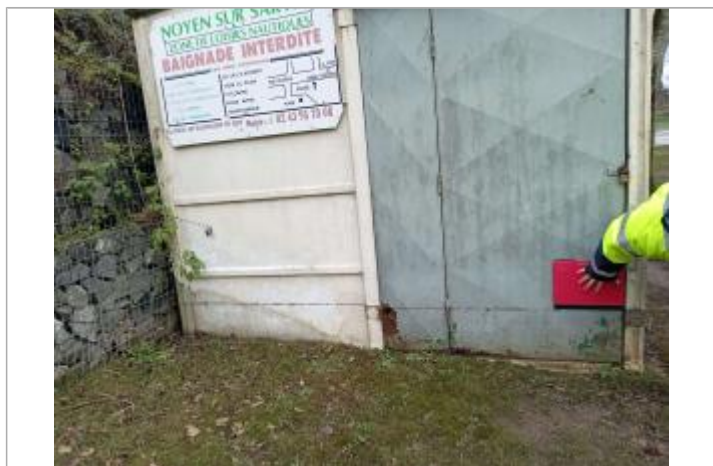
laisse de crue sur batiment de la zone de loisirs

Maximum de l'inondation : Oui Visibilité : Oui État du repère : Bon Pérennité : Aucune