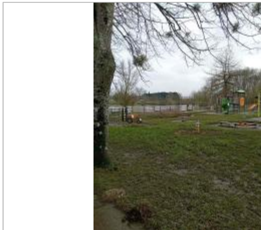
aire de loisirs à la décrue

Coordonnées WGS84 : X: -0.09713390 / Y: 47.86882410