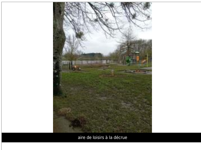
aire de loisirs à la décrue