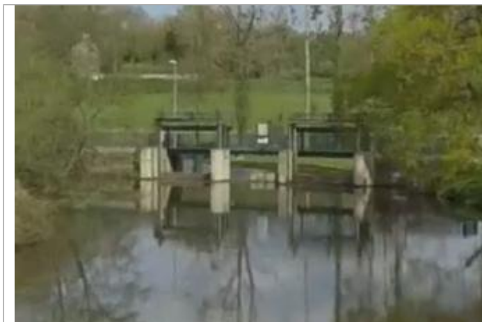
Amont vannage de Boutron

Coordonnées WGS84 : X: -2.01311251 / Y: 48.41617950