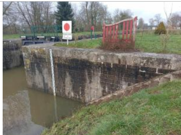
vue d'ensemble de l'aval de l'écluse, avec présence d'une échelle limnimétrique

Coordonnées WGS84 : X: -0.09818833 / Y: 47.85813330