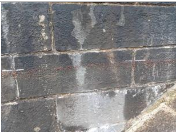
marquage au mur de la laisse de crue

Altitude calculée de l'eau (en m) : 31.66 m