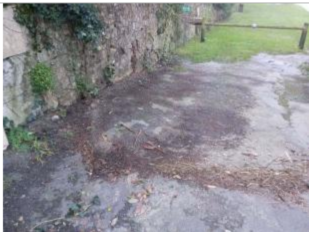
vue d'ensemble de la laisse d'inondation, avec en arrière plan le poteau sur lequel est marqué la laisse de crue.