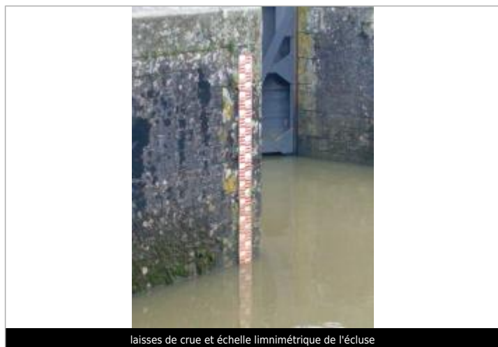
laises de crue et échelle limnimétrique de l'écluse

Maximum de l'inondation : Oui Visibilité : Oui État du repère : Non renseigné Pérennité : Aucune