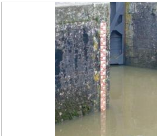
laisses de crue et échelle limnimétrique de l'écluse