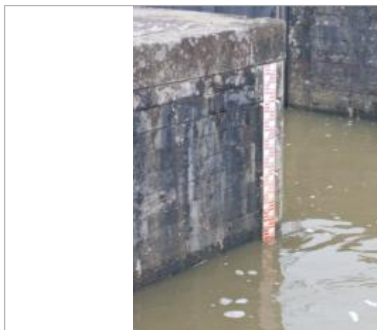
laisse de crue sur l'aval de l'écluse, avec échelle limnimétrique