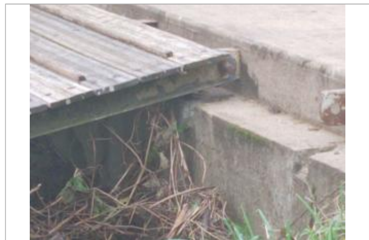
laisses de crue sur le mur

MARQUE Maximum de l'inondation : Oui Visibilité : Oui État du repère : Bon Pérennité : Non renseigné