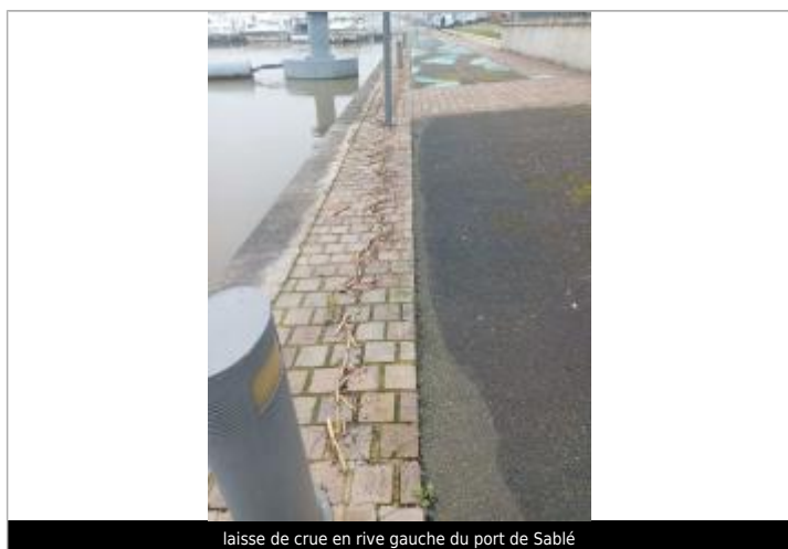
laisse de crue en rive gauche du port de Sablé